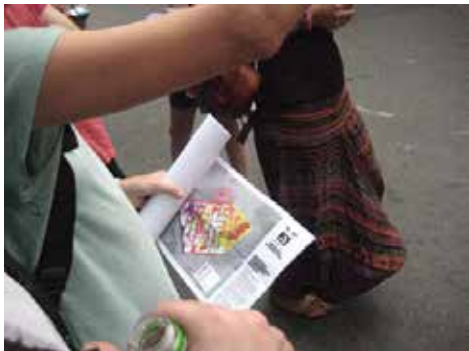
Cada participante llevaba un mapa con el que identificar que zonas desaparecerían en el barrio en los próximos 15 años, y en qué periodo de tiempo o fase.