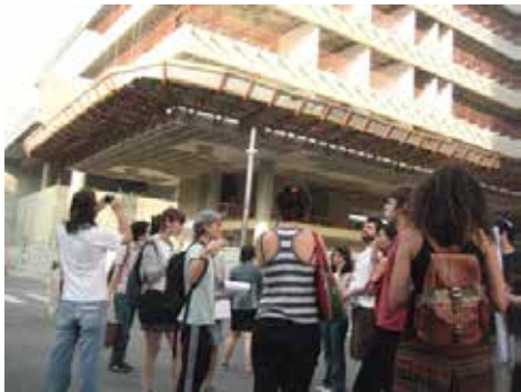
Fatec: Facultad de Tecnología, en construcción en el barrio. Dentro del Proyecto Nova Luz habrá ayudas fiscales para empresas ligadas a tecnología que quieran implantar su sede en el barrio.