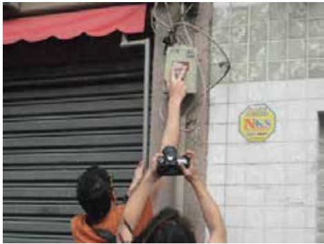
Colocando pegatinas con las fases de demolición. Local demolido en la Fase 4