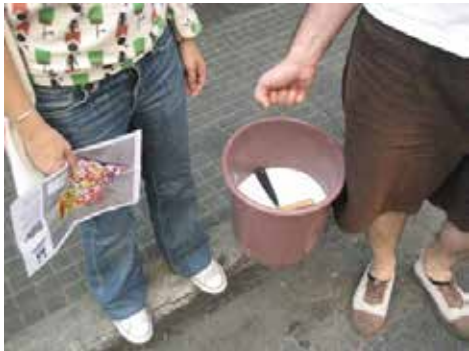
Parte del material repartido para la acción.