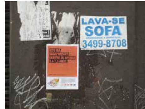
Fase naranja del Proyecto Nova Luz: “Esto desaparecerá dentro de 5 a 7,5 años”