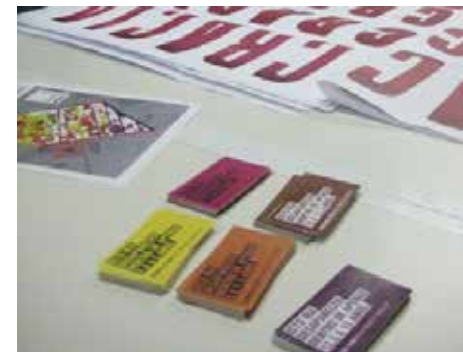
Pegatinas com as cinco fases de demolição