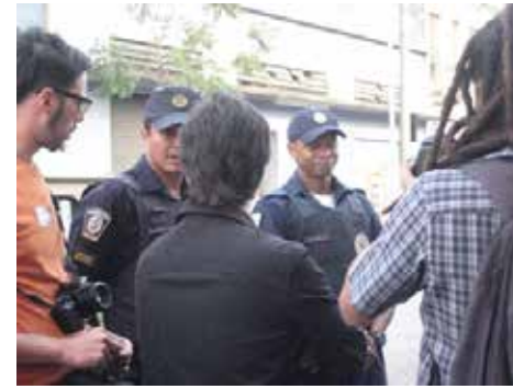
Grupo de participantes se entrevista con la policía local, que dan su visión sobre la problemática del barrio ligada al consumo de crack.