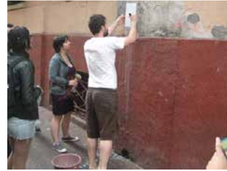
Se encolan los primero carteles identificando edificios que serán demolidos