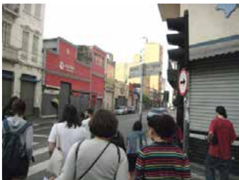
Comienza el recorrido por el Bairro da Luz