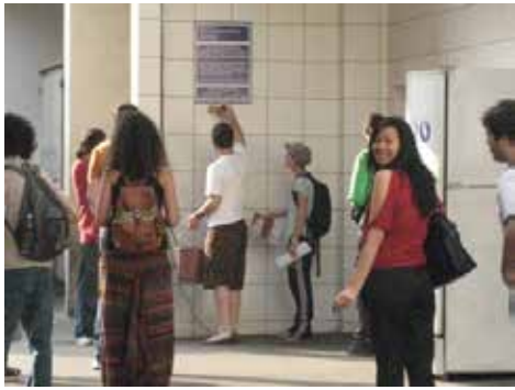
Colocando carteles: la gasolinera desaparecerá en la Fase 4