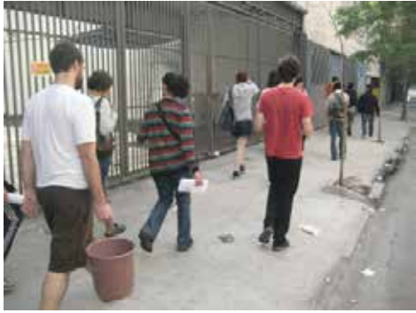
Una vez repartido el material los participantes del taller se dirigen al Bairro da Luz