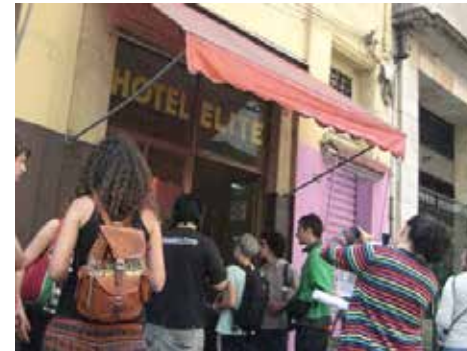
Algunos de los dueños de locales informaban a su vez al grupo de su experiencia con el Proyecto Nova Luz. El Hotel Elite lleva más de 50 años en el barrio y será demolido en la tercera fase del proyecto Nova Luz