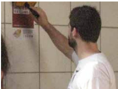
“Esto desaparecerá dentro de 10 a 12,5 años” Aquellos negocios que no se amolden a la nueva imagen del barrio serán erradicados