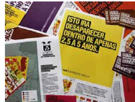
Material para a acção: Mapas, carteas e pegatinas