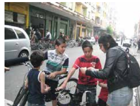
Informando a chicos del Bairro da Luz: “El barrio va a cambiar”