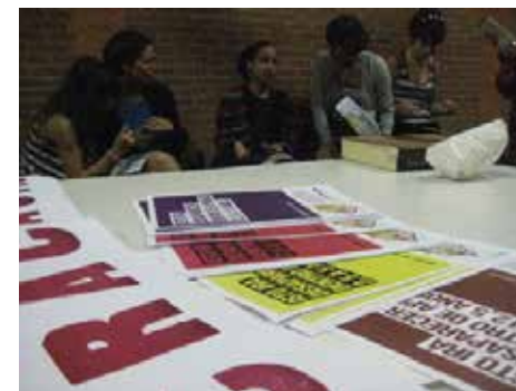
Os cinco cores das fases de demolição do Projecto Nova Luz representados em cinco tipos de carteas com a leyenda: “Esto desaparecerá dentro de X años”