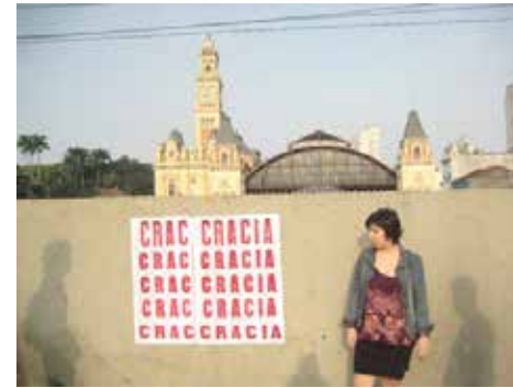
Integrantes del colectivo Anunciado en TV colocan uno de sus carteles CRACIA, haciendo alusión a la estigmatización del barrio como “Crackolandia” (CracCRACIA)